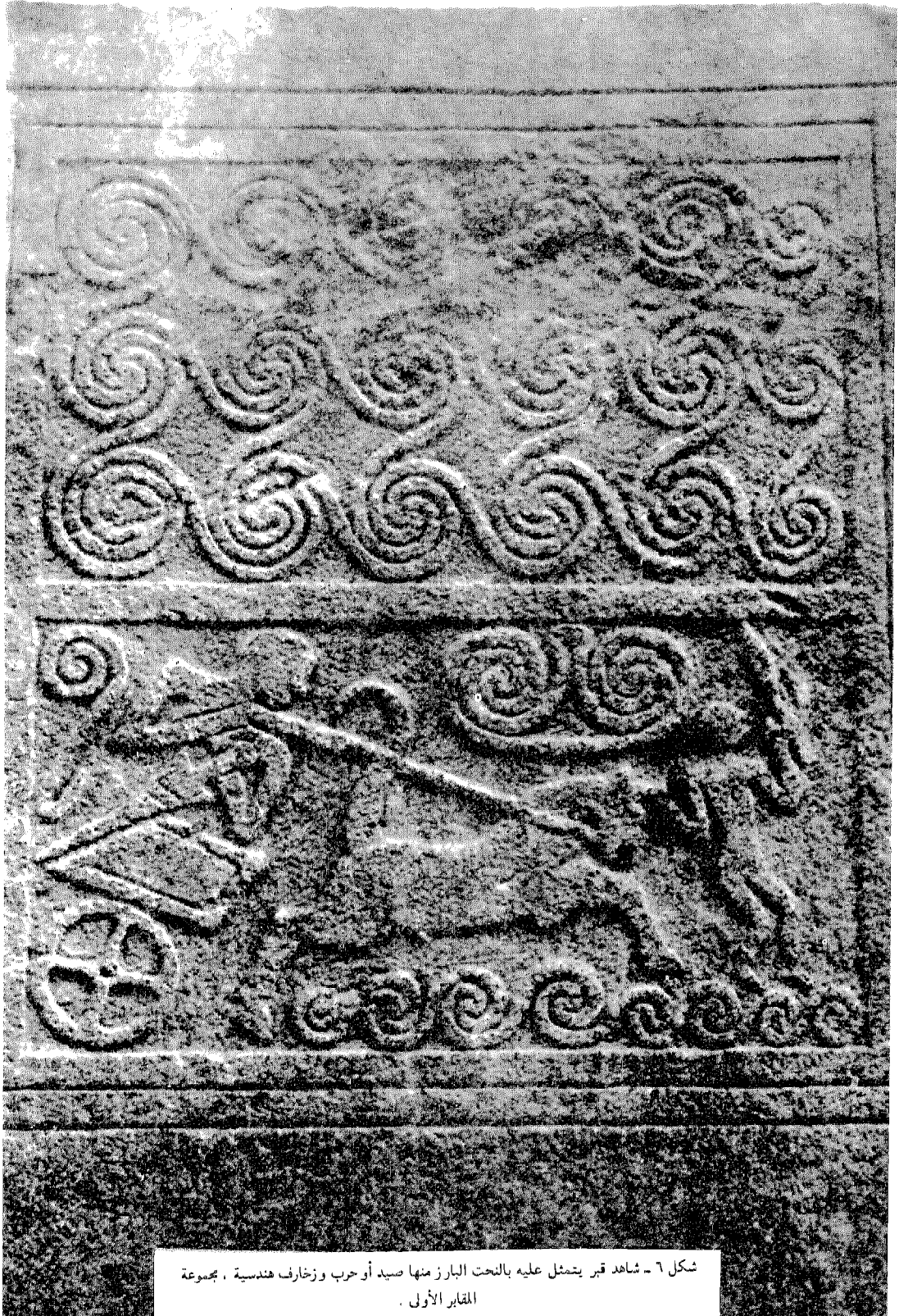
شكل ٦ - شاهد قبر يتمثل عليه بالنحت البارز منها صيد أو حرب وزخارف هندسية ، مجموعة المقابر الأولى .